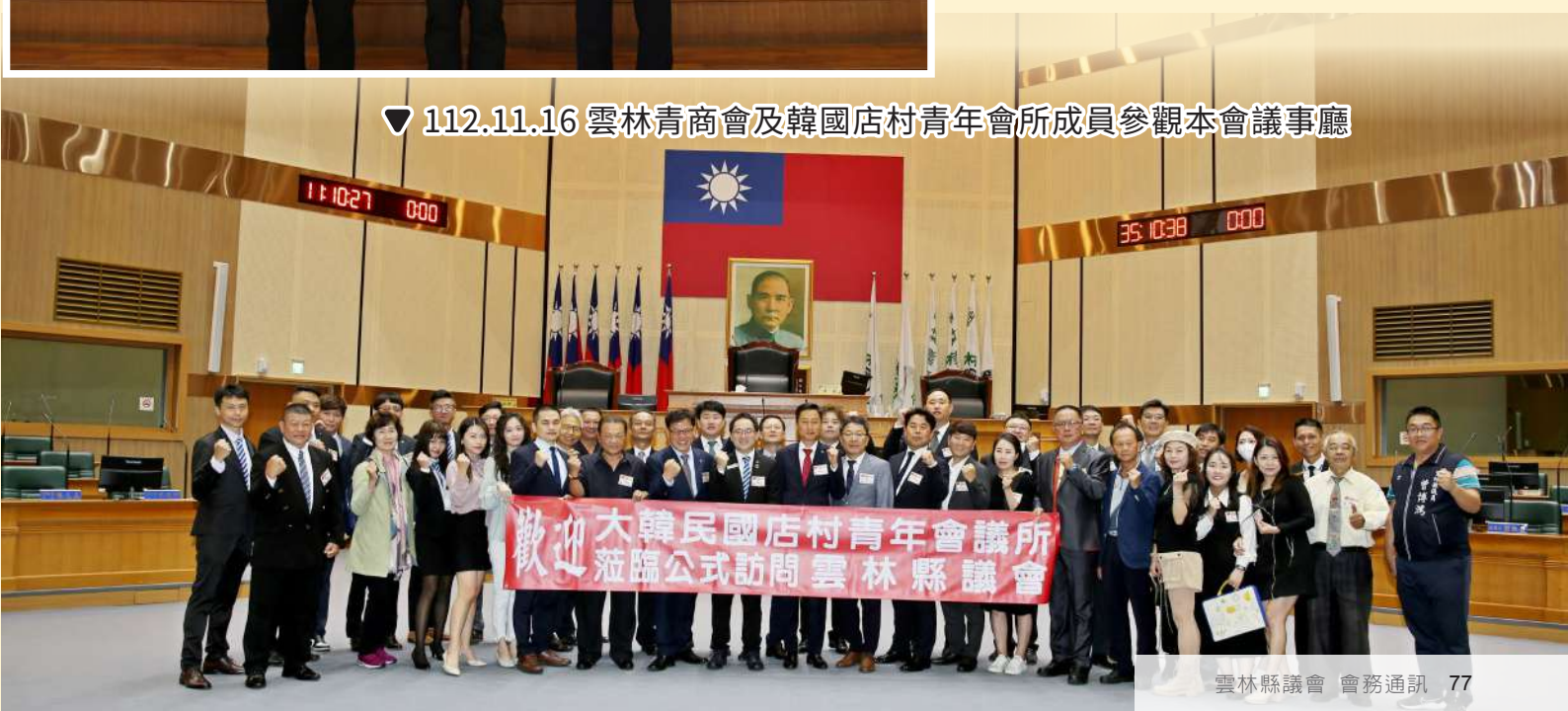
▼ 112.11.16 雲林青商會及韓國店村青年會所成員參觀本會議事廳