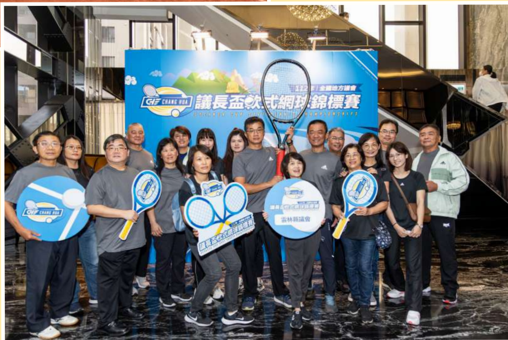
◆ 112.09.11 本會組隊參加彰化縣議會舉辦之全國地方議會議長盃軟式網球錦標賽