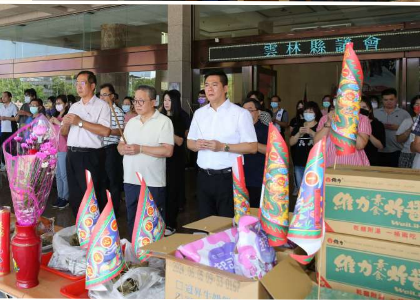
◀ 112.08.25 雲林縣議會中元節普渡 拜拜－祈求拜請會務順利平安吉祥