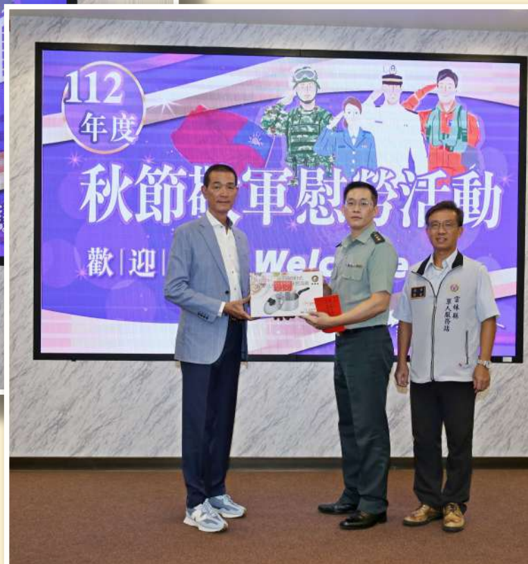
▲ 112.09.14-112年度秋節敬軍慰勞活動— 本會致贈受慰部隊加菜金及紀念品