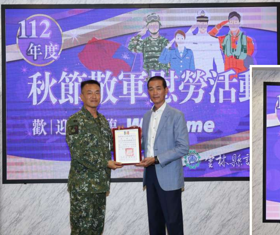
▲ 112.09.14-112年度秋節敬軍慰勞活動— 軍方代表致贈本會感謝狀