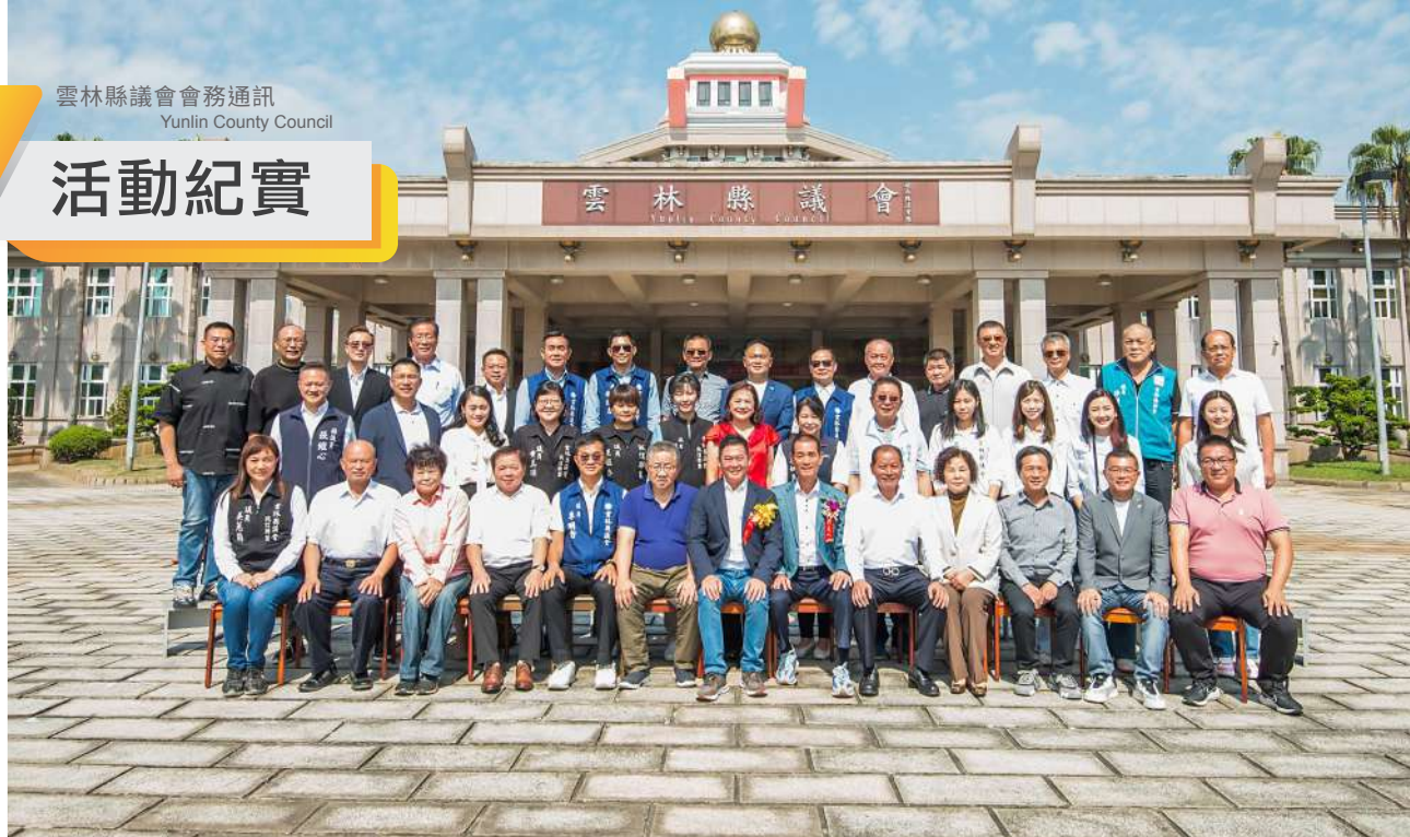
▲ 112.10.30 第20屆議長補選暨就職典禮後本會全體議員在議會民主廣場大合照